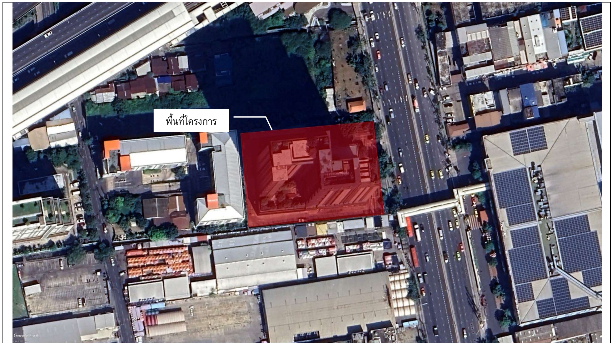
ที่มา : แผนที่ทางอากาศ Google Earth, 2567